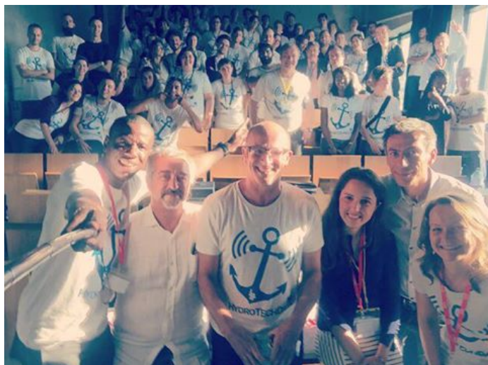
Le selfie du jury après la remise des prix

Le samedi 11 juin à 19h a eu lieu la cérémonie de remise de prix du hackathon HydroTechDays , après 24h de réflexion et d'effervescence créatrice autour du numérique au sein de l'école nationale supérieure maritime du Havre.