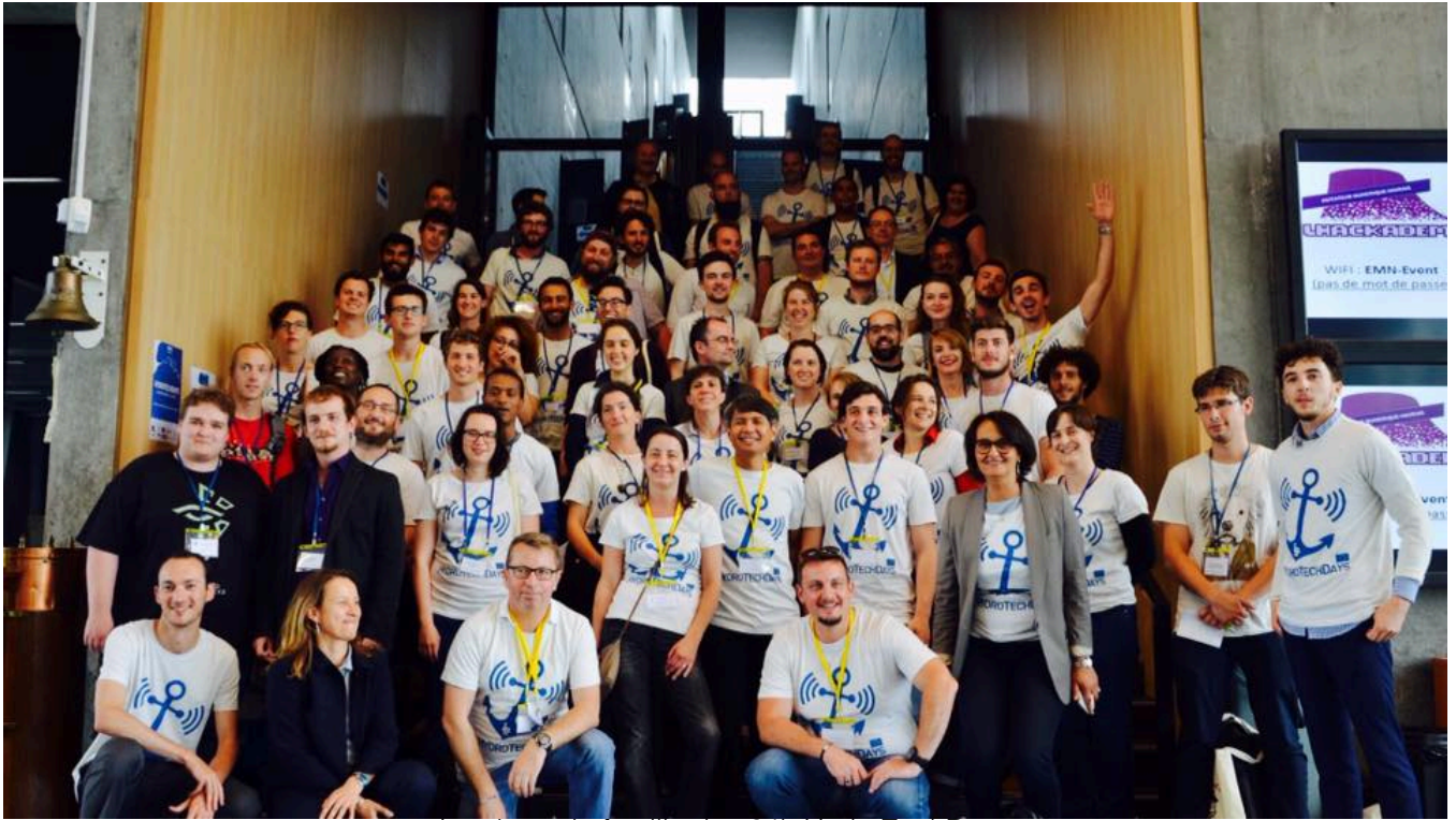
La photo de famille des 24h HydroTechDays.